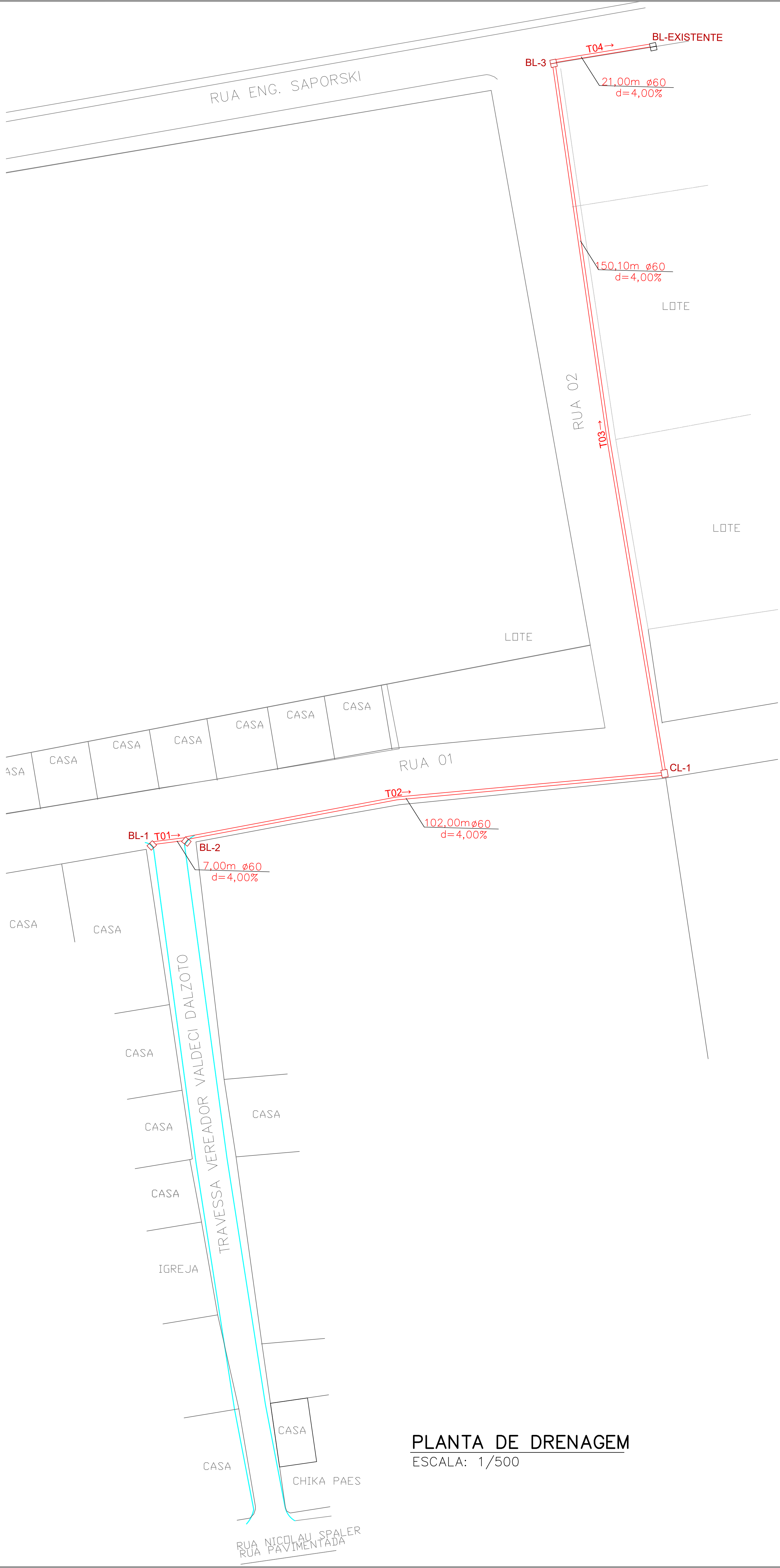
PLANTA DE DRENAGEM ESCALA: 1/500